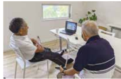
ケアメン講座(9/18、オンライン開催)の様子

コロナ下であっても色々な方とネットワークを広げ、オンライン等活用した新たな取組を実践しながら、小さな枝葉が成長し、大きな実を結ぶことができたらと考えています。ケアラー支援の輪がさらに広げられるよう活動を進めています。