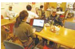
てとりんハウスの様子(相談対応中)

やリフレッシュのための企画などを定期開催しているほか、毎月1回お店を閉めてケアラーだけの集まり(つどい)を開催しています。